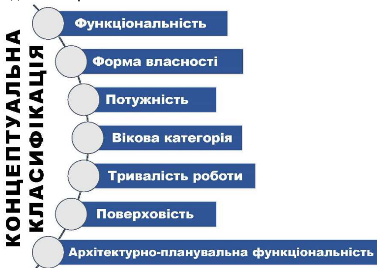
Рис. 2. Основні ознаки концептуальної класифікації закладів дошкільної освіти, що пропонується

Концептуальна класифікація складається з семи основних ознак, наведених на рис. 2.