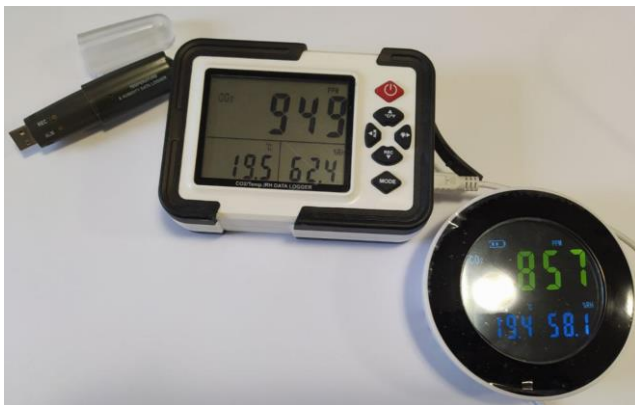
Рисунок 1 – Прилади для вимірювання параметрів мікроклімату