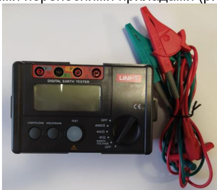
Рисунок 4 – Цифровий вимірювач опору заземлення (UT522)