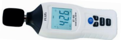
Рисунок 3 – Прилади для вимірювання рівня шуму (шумомір)

Вимірювання рівня шуму виконують за допомогою шумоміра (рис. 3).