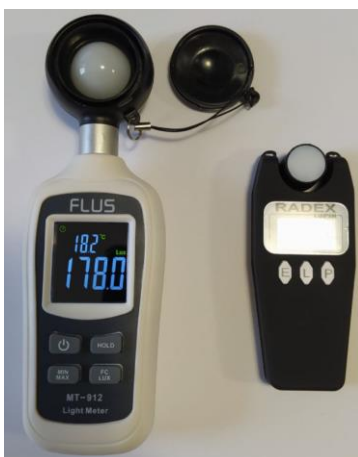
Рисунок 2 – Прилади для вимірювання освітлення (люксметр)