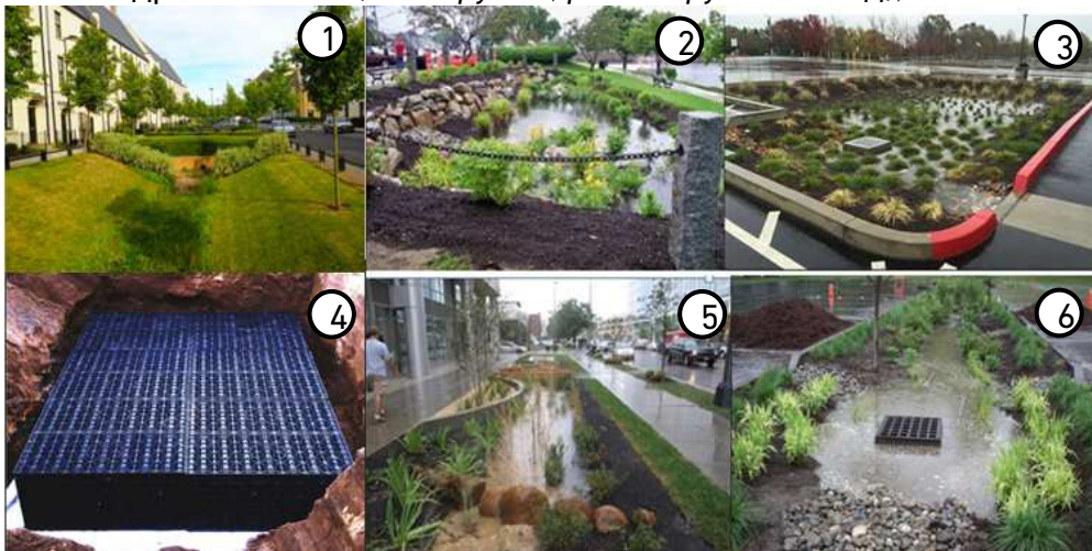
Рис. 2. Споруди регулювання дощового стоку:

1 – рослинні канали (фільтраційні траншеї); 2, 3 – біоаккумуляційні площі; 4 – дренажні блоки; 5, 6 – біостримуючі смуги