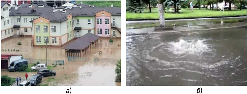
Рис. 1. Затоплення міських територій: а) за відсутності колекторів дощового водовідведення; б) через мережі дощового водовідведення при роботі їх у напірному режимі

Основні причин затоплень і підтоплень урбанізованих територій пов'язують, головним чином, зі змінюю клімату , що призводить до