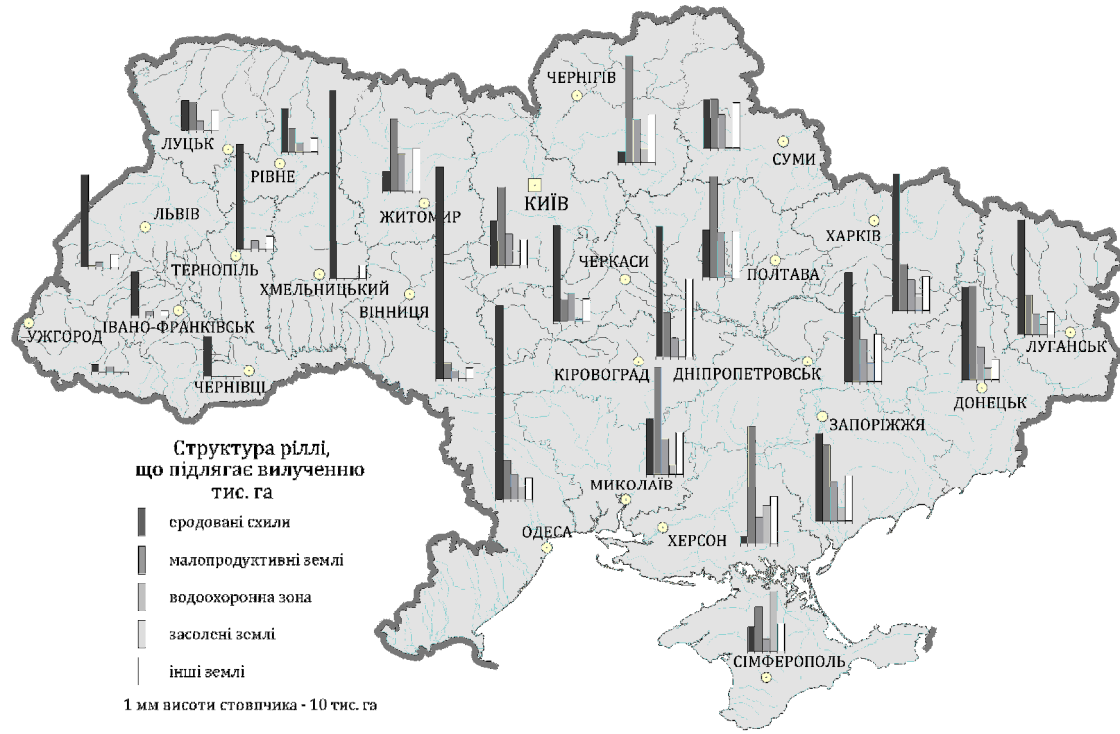
Рис. 3. Вилучення ріллі