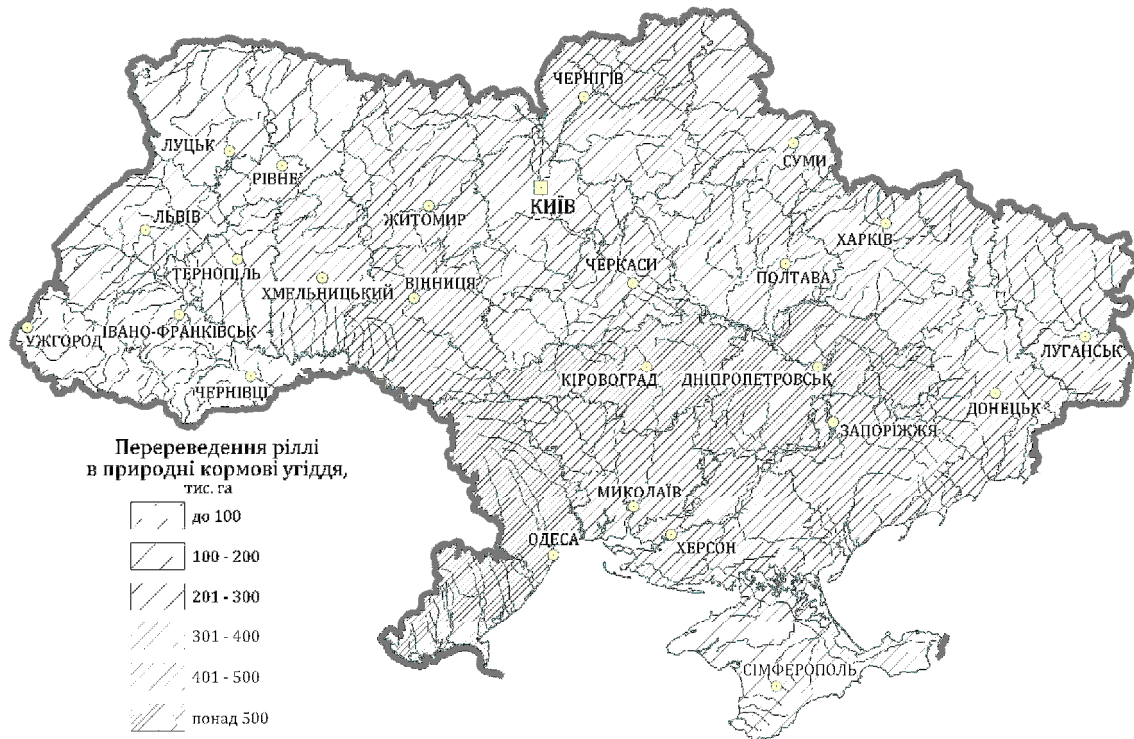
Рис. 4. Переведення ріллі у природні кормові угіддя