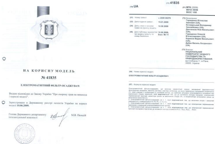
Рис. 2. Перша та друга сторінки патенту на корисну модель