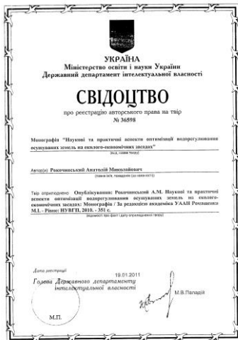
Рис. 3. Перша сторінка свідоцтва права на твір (монографію, посібник, тощо)