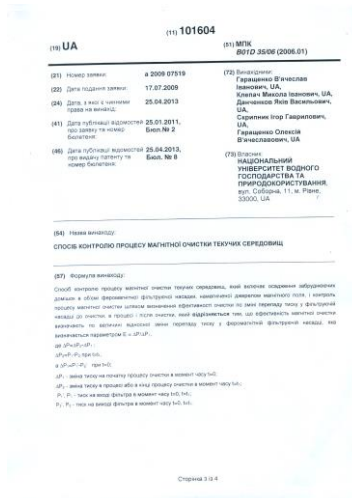
Рис.1. Перша та друга сторінки патенту на винахід України