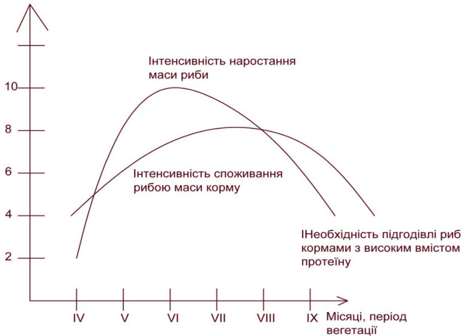
Рис. 1. Динаміка ростових процесів риби при напівінтенсивній технології годівлі

При каскадному методі годівлі нетрадиційними кормами на початку вегетаційного періоду необхідні корми з максимальним вмістом протеїну, коли проходять інтенсивні процеси наростання маси риби і догодовування в кінці вегетації, коли знижуються процеси наростання біомаси і необхідні джерела енергії – маса вуглеводів (крохмаль), тут допоможе пророщене зерно пшениці та голозерний овес.