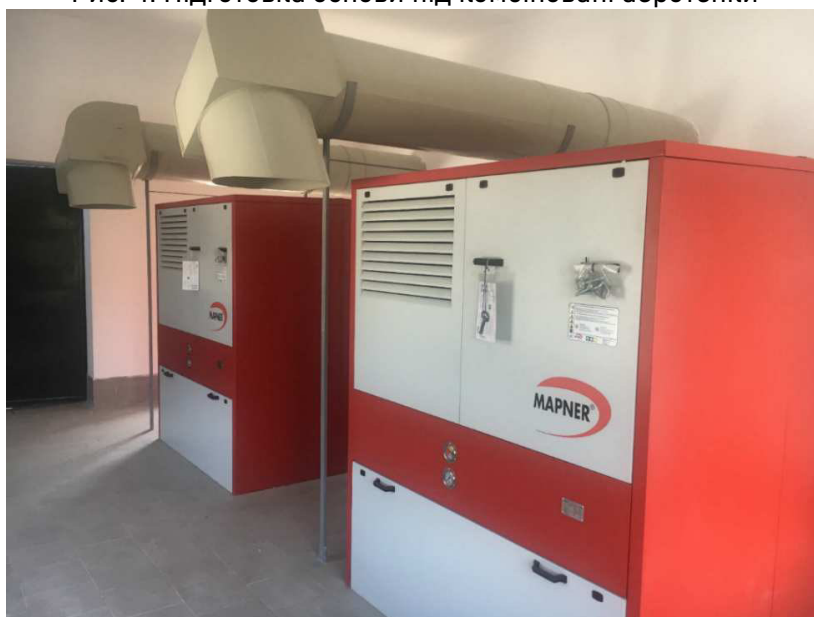
Рис. 5. Повітрорудна станція

Головним елементом реконструйованих очисних споруд є