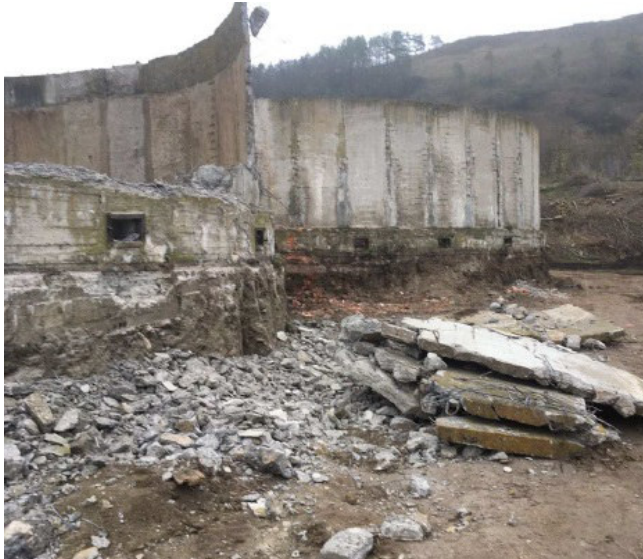
Рис. 3. Демонтаж стін біофільтра