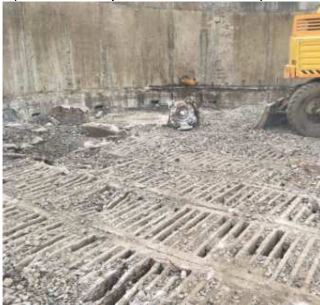
Рис. 2. Вивантаження завантаження і демонтаж дренажу біофільтра

Слід підкреслити, що при реконструкції очисних споруд міста Чортків застосовувалися як передові технології будівельного виробництва (рис. 4), так і сучасне обладнання (рис. 5).