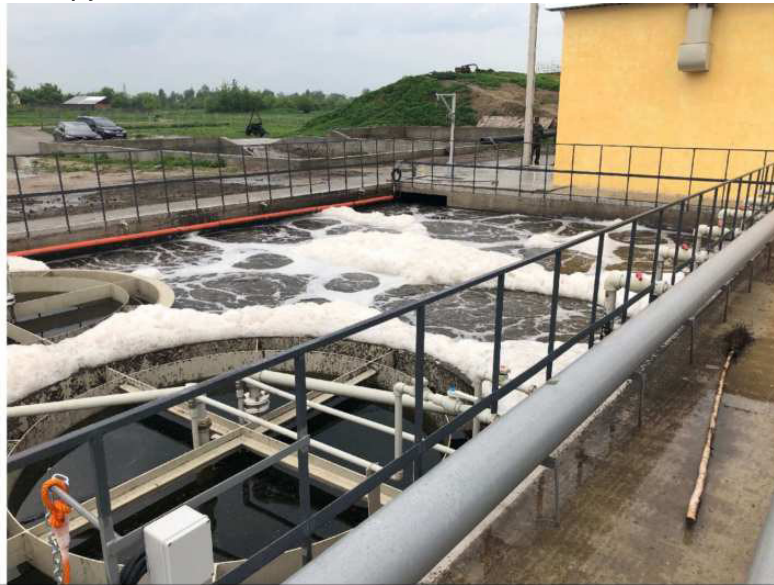
Рис. 6. Аеротенки очисних споруд міста Чортків

Запуск аеротенків у роботу (рис. 6) здійснювався за допомогою «затравкового» мулу із найближчих працюючих каналізаційних очисних споруд.