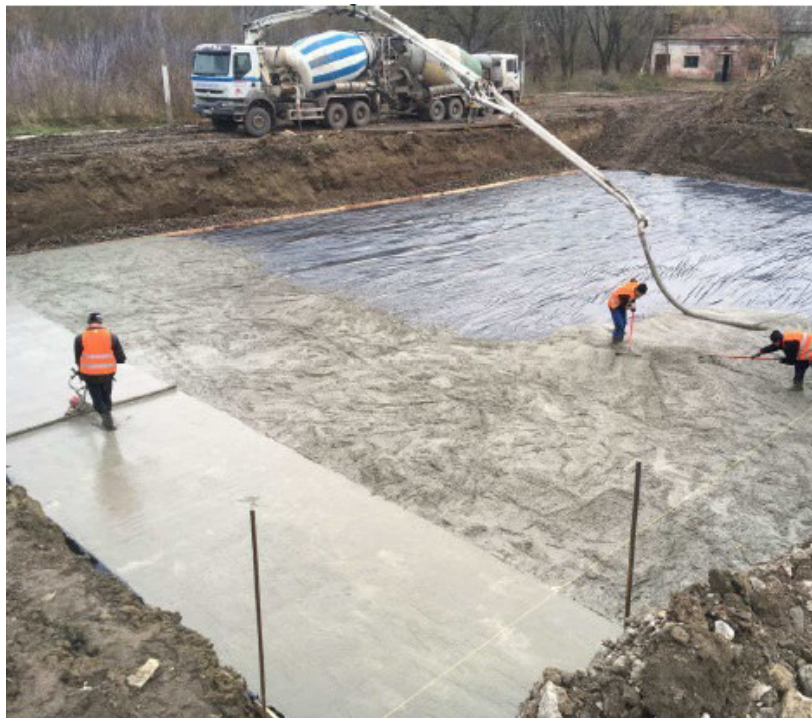
Рис. 4. Підготовка основи під комбіновані аеротенки