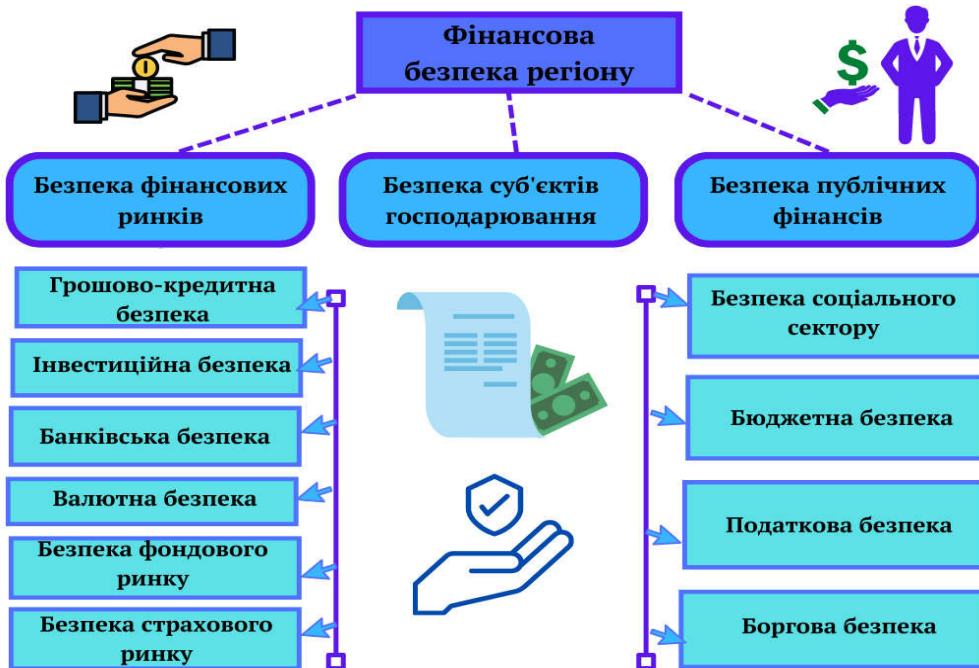
Рис. 3. Структура фінансової безпеки регіону *