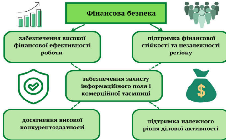
Рис. 1. Основні цілі забезпечення фінансової безпеки регіону*

Основні цілі забезпечення фінансової безпеки регіону включають (рис. 1): підтримку фінансової стійкості та незалежності регіону; фінансову ефективність роботи; захист інформаційного поля та комерційної таємниці; досягнення конкурентоздатності регіону; підтримку належного рівня ділової активності.