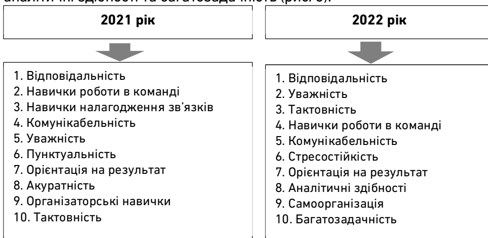
Рис. 3. Перелік бажаних soft skills у вакансіях [18]

На сьогодні роботодавці почали звертати більшу увагу на soft skills майбутніх співробітників, описуючи пропоновану вакансію. Зокрема в Україні у 2022 р. порівняно з 2021 р. кількість роботодавців, які в описі своїх вакансій зазначають бажані soft skills, зросла на 10% та становить 75%. При цьому перелік ключових скілів зазнав певних змін після початку війни, зокрема зросла затребуваність на стресостійкість, аналітичні здібності та багатозадачність (рис. 3).