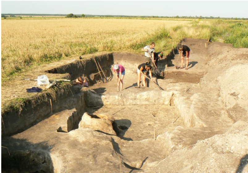
Фото 4. Дослідження житлових і господарських будівель доби середньовіччя поблизу с. Хрінники в 2012 р.

виявляється завдяки значним вкрапленням глиняної обмазки, вугликів, концентрації знахідок.