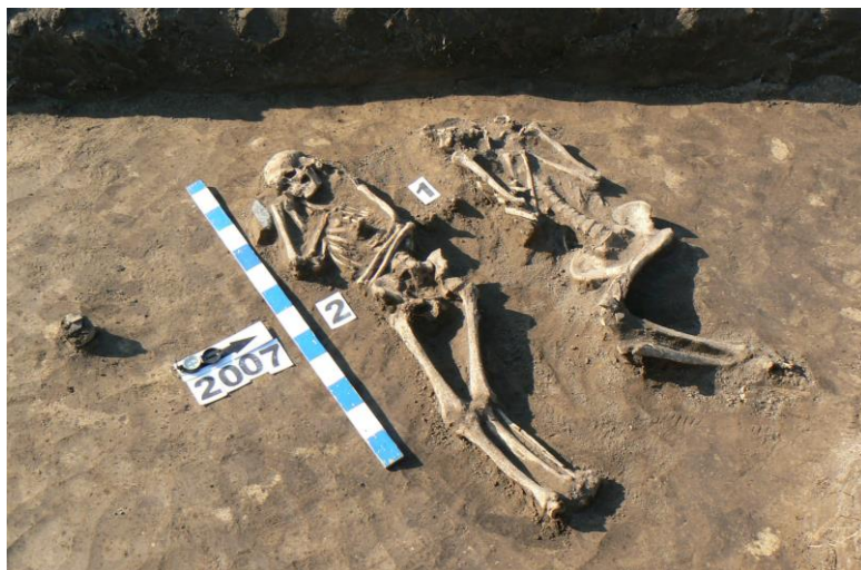
Фото 5. Парне поховання бронзового віку, виявлене під зруйнованим курганом поблизу с. Ясне. 2007 р.

знарядь праці, кераміки, предметів озброєння, прикрас тощо. При цьому нічого не повинно бути зрушене з місця.