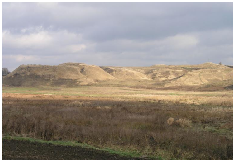
Фото 2. Загальний вигляд Білівського городища.

підвищується над рівнем заплави ріки чи навколишньої території. Описуючи вал, фіксують його висоту від рівня сучасної денної поверхні на майданчику городища, ширину на рівні підосви, крутизну схилів, чи охоплює він увесь майданчик, чи простежується лише з однієї чи кількох сторін. Для оборонних ровів вказують ширину на рівні сучасної денної поверхні, глибину і крутизну схилів.