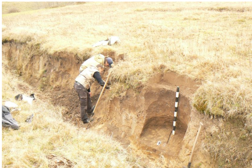
Фото 1. Давні об'єкти виявлені в промоїні, яка утворилася після дощів. Село Листвин, 2010 р.

навколишніми долинами, а отже давнім мисливцям було зручно вести спостереження за тваринами, на яких вони полювали, і в першу чергу – за мамонтами.