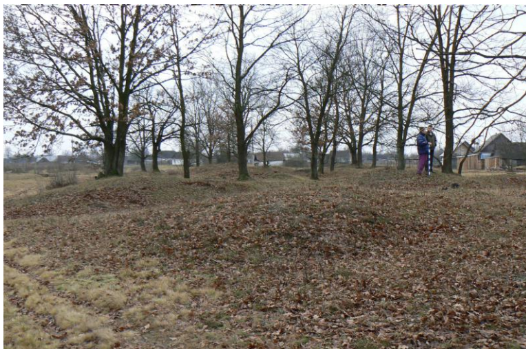
Фото 3. Курганний могильник у с. Біловіж, 2007 р.

конус тощо; у плані округлий, овальний, витягнутий). Необхідно вказати висоту і діаметр кургану на рівні денної поверхні, чи простежується рівчак навколо насипу, його ширину і глибину. Слід звернути увагу на збереженість насипів: непорушений задернований, розораний, частково зруйнований, розкопаний колодязем чи траншеєю. Обов'язковим є опис топографічних умов розташування курганного могильника, віддаленість його від водних об'єктів, поселень і городищ, з якими він може бути пов'язаний.