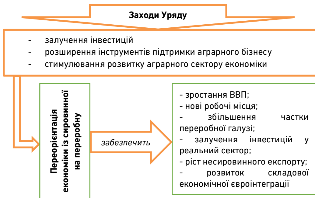
Рис. 2. Напрями державної аграрної політики України в 2024 році

Протягом 2024 року уряд України планує сприяти позитивному аграрному розвитку, головним пріоритетом якого є переорієнтація економіки країни із сировинної на переробну (рис. 2), що включає наступні програми з підтримки сільськогосподарських виробників: