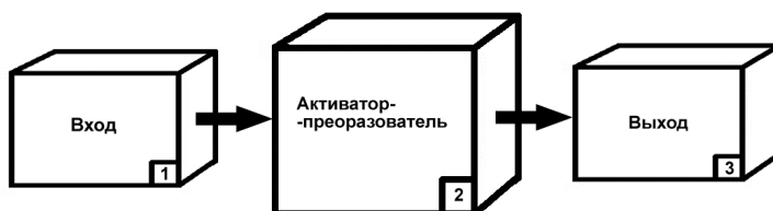
Рис. 2. Обобщенная структура вероятностного возникновения результата

На пути инновационного поиска и его утверждения возможна, имеет место следующая промежуточная, упрощенная модель: