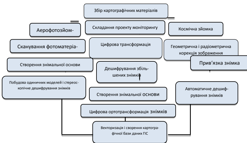
Рис. 2. Технологія моніторингу територій за матеріалами аеро-і космічних зйомок [9]

За першим варіантом проводиться сканування матеріалів аерофотозйомки і їх попередня обробка, потім створюється знімальна основа з фототриангуляцією. Обробка проводиться на основі стереознімання на цифрових фотограмметричних станціях.