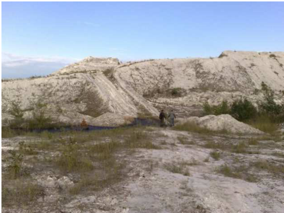
Рис. 1. Техногенне родовище фосфогіпсу (відходи ПАТ «РІВНЕАЗОТ»)

Сучасним розробкам щодо переробки та утилізації фосфогіпсу присвячені роботи багатьох науковців та вчених України і зарубіжжя, зокрема А. Ф. Булата, В. А. Іванова, К. С. Голова [2; 3], І. А. Трунової, Р. В. Сидоренка [4], Р. А. Чернишевої [5], Л. Й. Дворкіна [6].