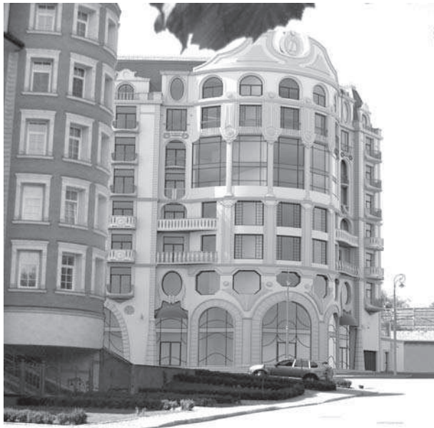
Рис. 3. Загальний вигляд енергетично-ефективного будинку

Одним із пілотних розроблявся проект будівництва енергетично-пасивного житлового будинку по вул. Тимірязевській, 28 у м. Київ. Розробка даного проекту супроводжувалась складнощами просторової орієнтації, адже проектування проводилося в умовах ущільненої забудови та обмеженої площі земельної ділянки.