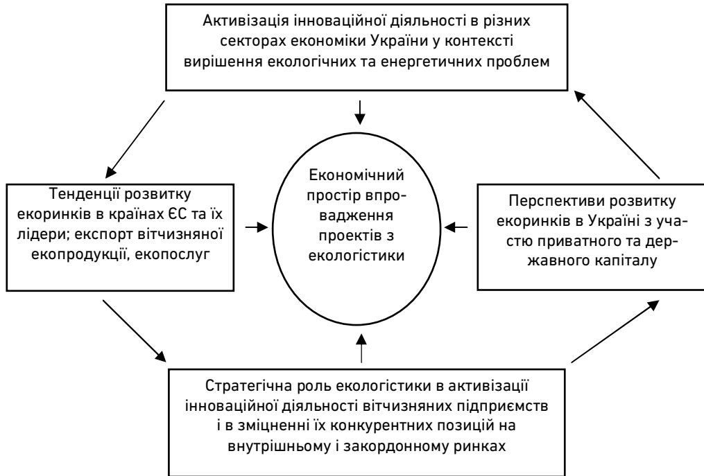
Рис. 4. Розвиток екологістики як неперервний взаємообумовлений процес активізації інноваційної діяльності підприємницьких структур під тиском критичних факторів виробництва

У сукупності і взаємодії всі регульовальні заходи розвитку національних економік, що визначали напрямки екологічної орієнтації логістики, дозволили якісно змінити її функціональне навантаження і стратегічне значення в процесах створення вартості та суспільних цінностей.