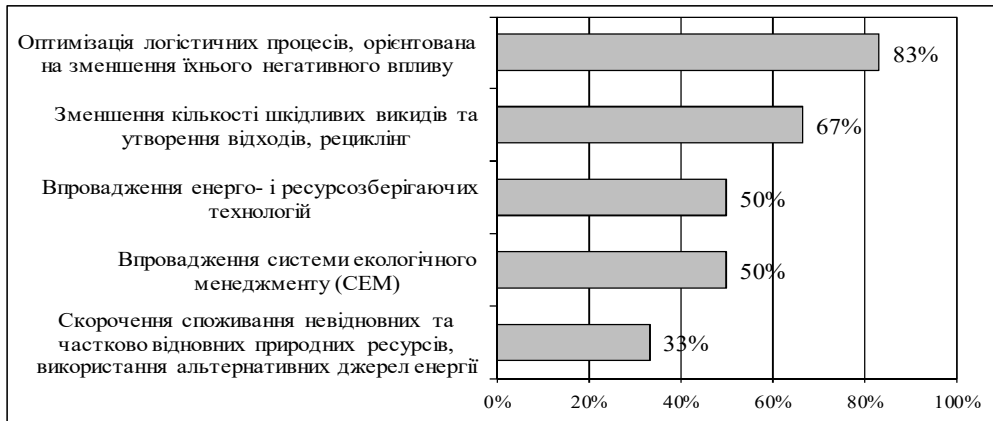
Рис. 1. Частка компаній, які реалізують екологічні заходи з метою зменшення негативного впливу на середовище та його захисту