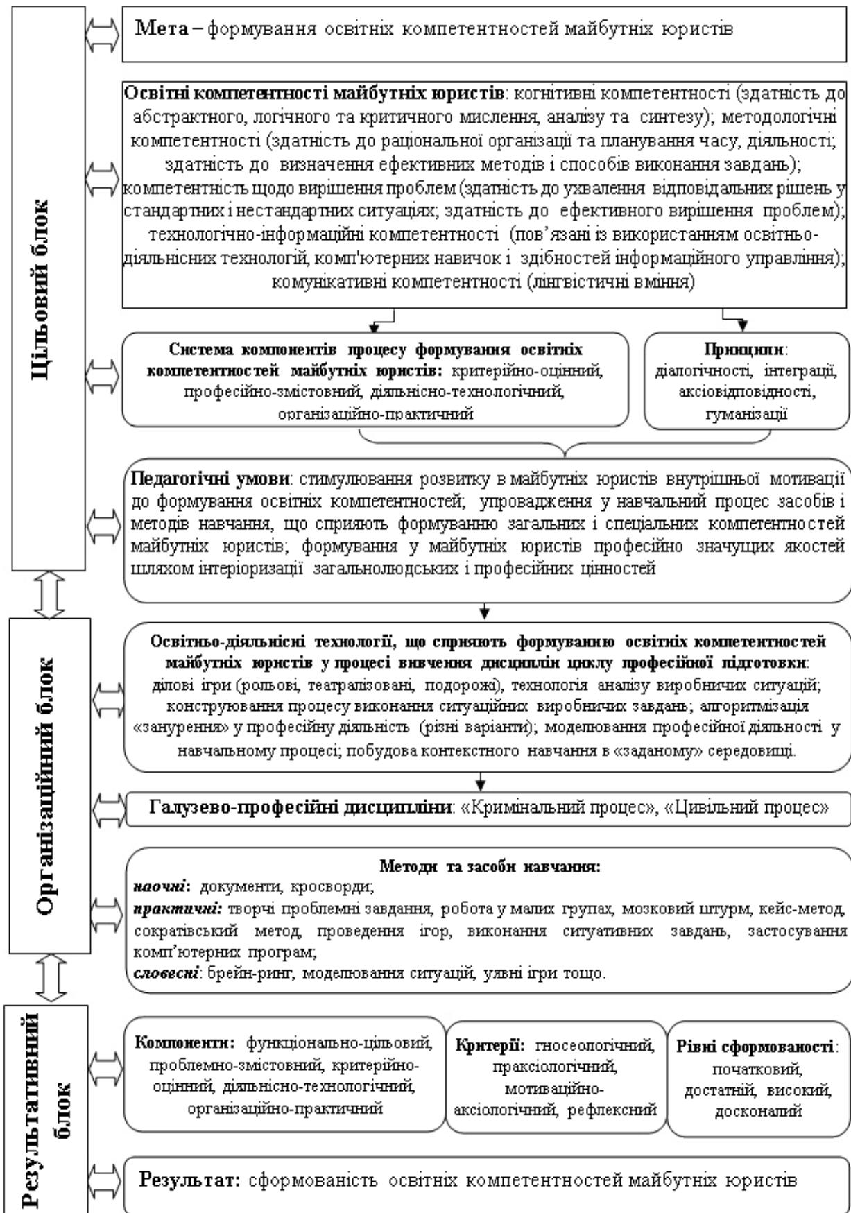
Рис. 1. Структурно-функціональна модель формування освітніх компетентностей майбутніх юристів у процесі вивчення дисциплін професійної і практичної підготовки